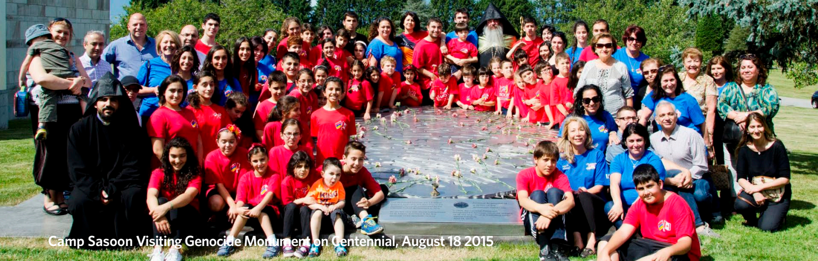
Camp Sasoon Visiting Genocide Monument on Centennial, August 18 2015