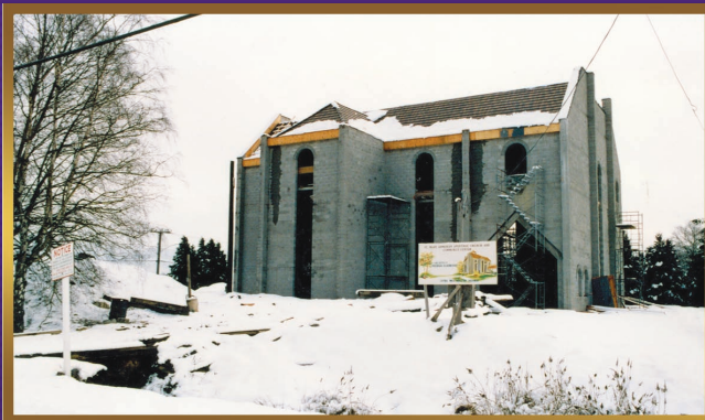
Building continues 1984