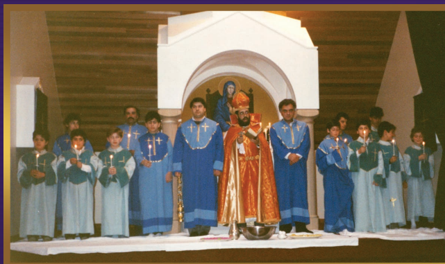
First 'Washing of the feet' Ceremony