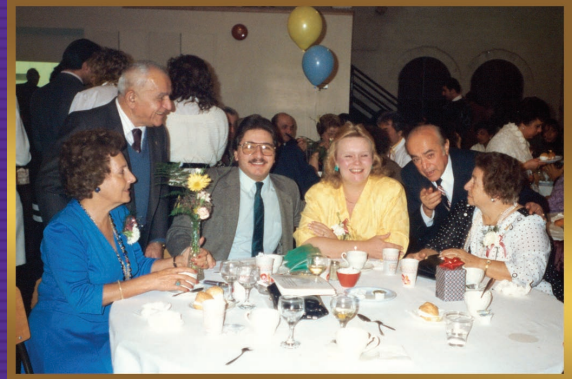
Lazarian Hall opening celebration