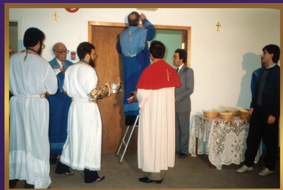
Church and Icons anointed