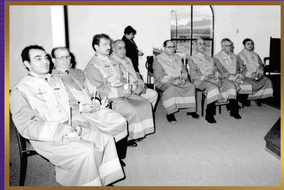
Godfathers of the Church