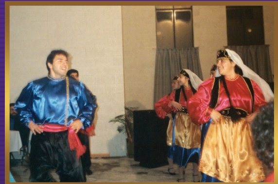
Lazarian Hall opening celebration