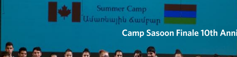
Camp Sasoon Finale 10th Anniversary, August 21 2016