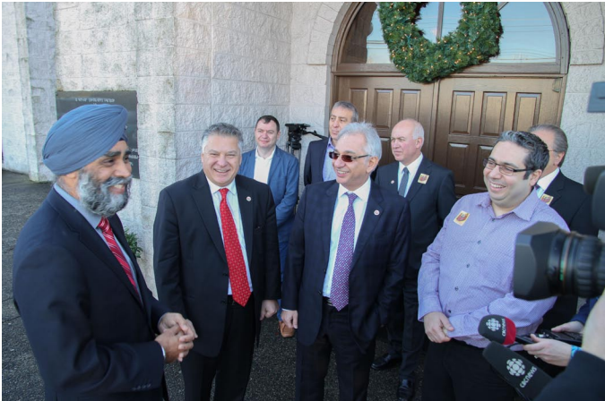
Minister of Defence, the Hon. Harjit Sajjan, speaking with members of the Armenian National Committee of Canada and Church Parish Council.

Fr. Hrant Tahanian: (who was born in Montreal but whose parents were refugees of the Lebanese civil war in the late 70's) shared these thoughts: “Sponsoring/resettling refugees for a country like Canada is common sense from all angles. Historically- Canada was established by refugees; economically- it is a major driving force; religiously- Jesus started out as a refugee; ethically- humanitarian assistance has been a sincere pride for Canadians. Undoubtedly, proper procedures and screenings are essential, but the decision taken to help - either by our small community, the broader Canadian public, or the Canadian Government - an imperative.”