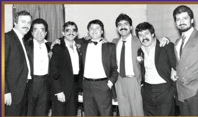
Lazarian Hall opening celebration