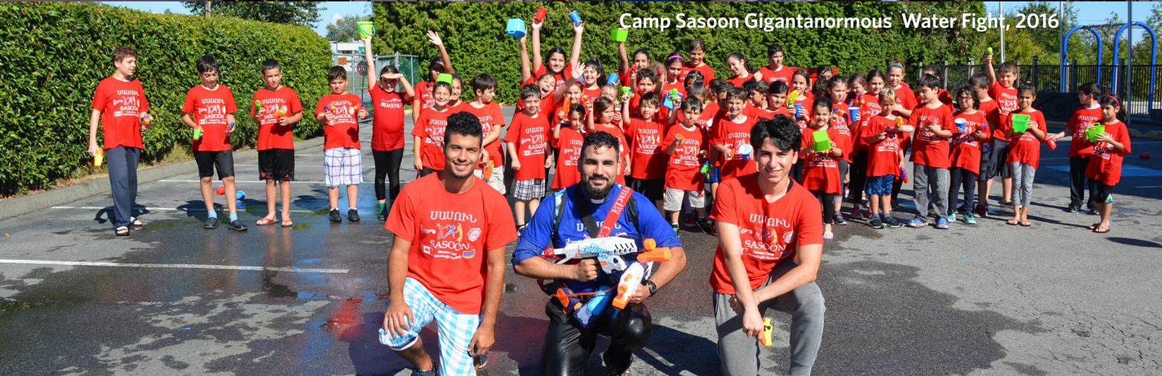
Camp Sasoon Gigantanormous Water Fight, 2016