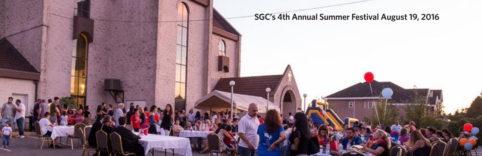
SGC's 4th Annual Summer Festival August 19, 2016