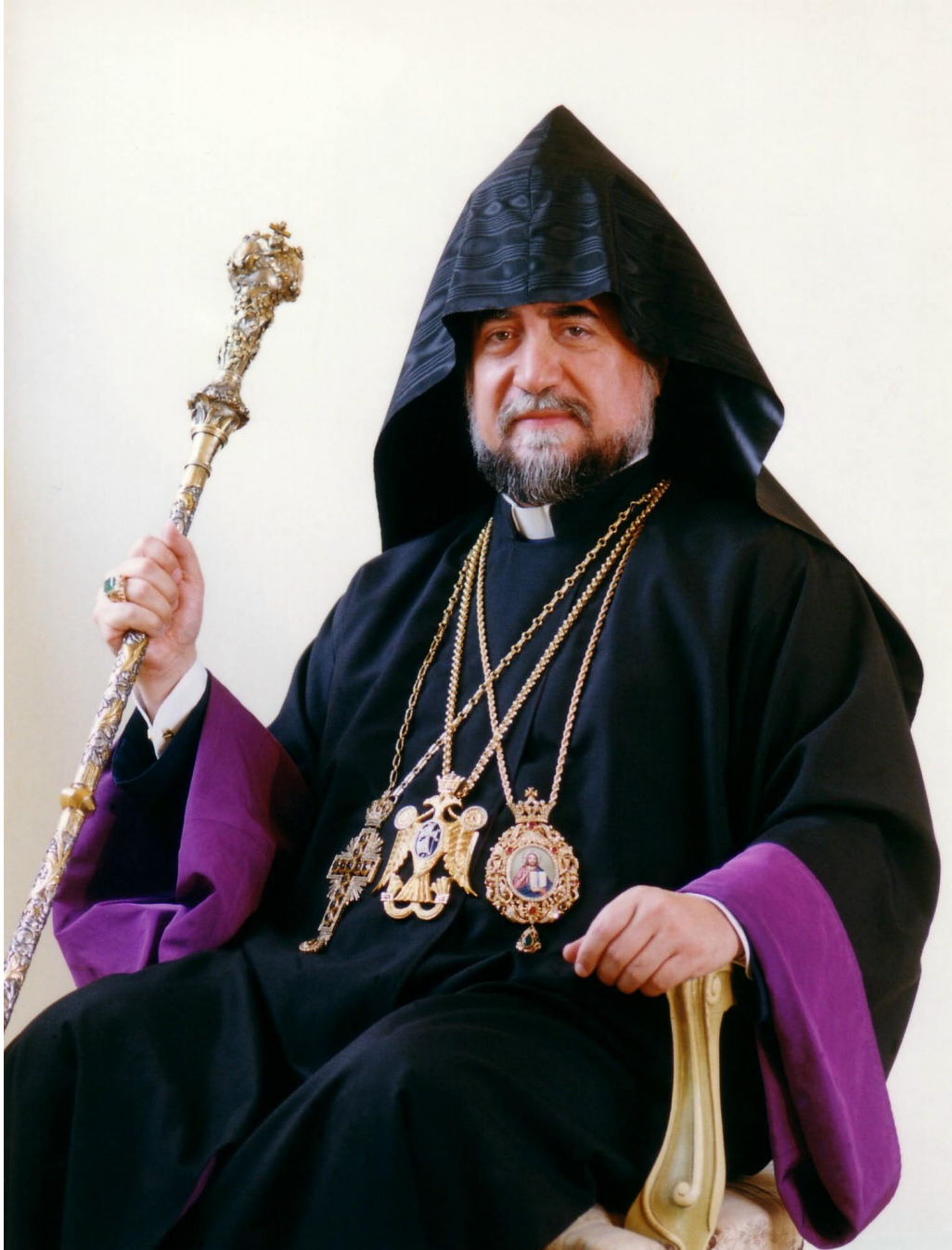
Ն.Ս.Օ.Տ.Տ. Արամ Ա Կաթողիկոս Ամենայն Հայոց Մեծի Տանն Կիլիկիոյ His Holiness Aram I, Catholicos of the Great House of Cilicia