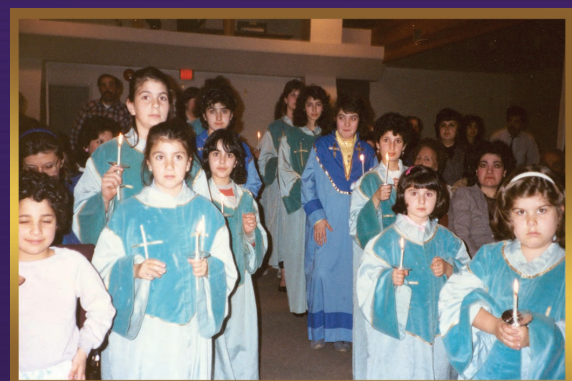
First '10 Virgins' Ceremony