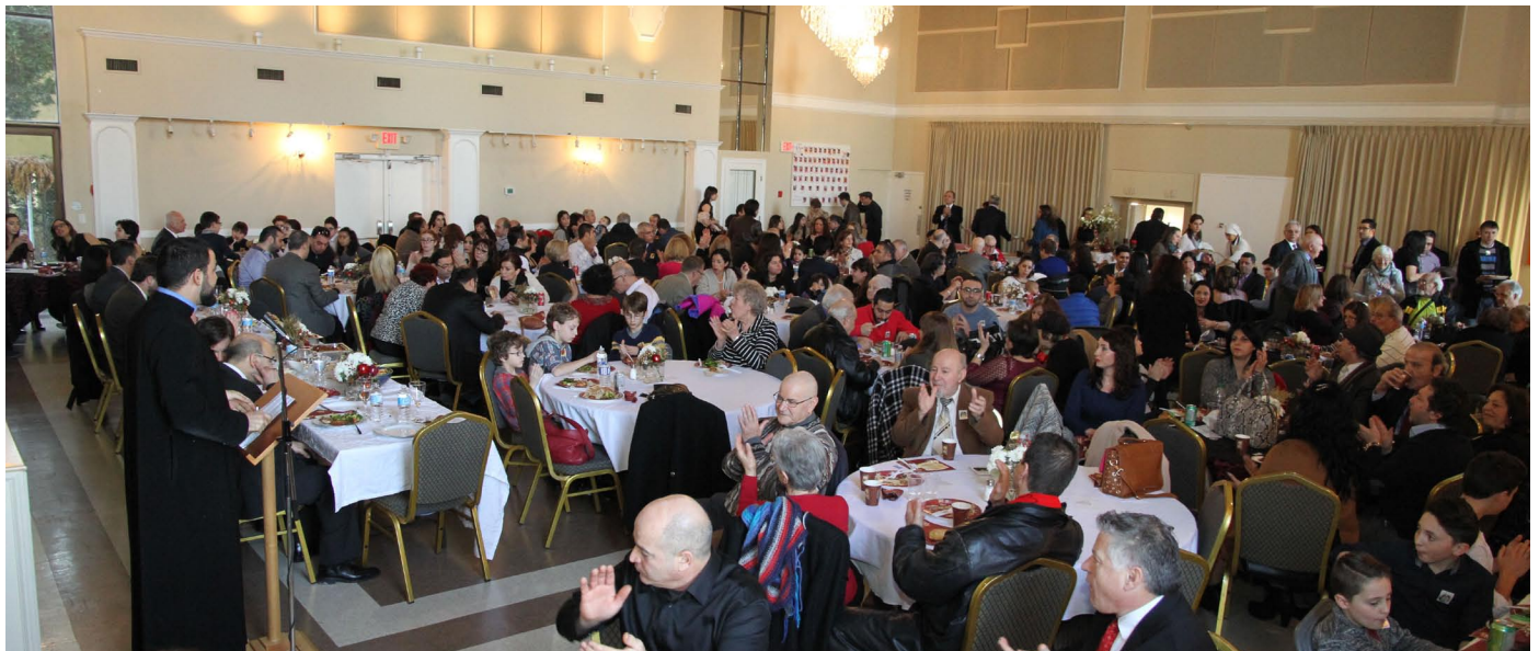
Syrian refugees enjoy their first Christmas Lunch along with their fellow church members, and fully appreciate that they are no longer refugees, but officially 'permanent residents,' on their way to full Canadian citizenship, in their new home, Canada.