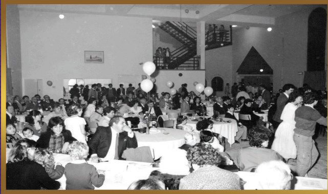
Lazarian Hall opening celebration