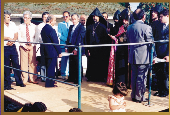
Blessing of the land