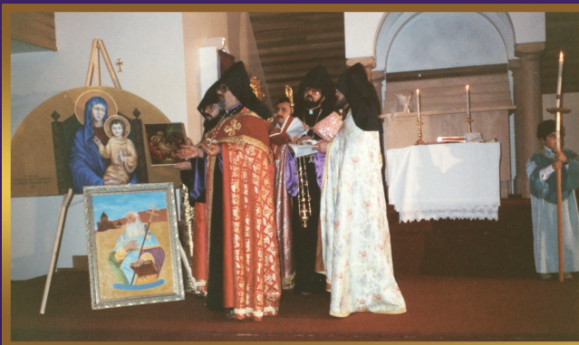
Church and Icons anointed