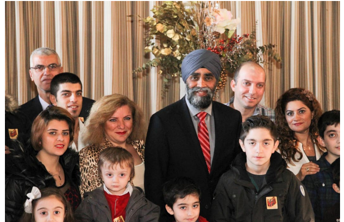
The Minister welcoming Syrian refugees to Canada, at St Gregory Armenian Church and Community Centre on January 10th, 2016.