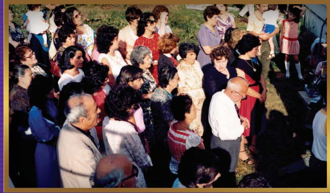
Blessing of the land