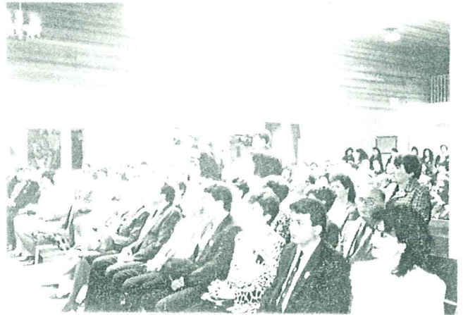
Բարեպաշտ ժողովուրդը կրօնական արարողութեանց պահուն