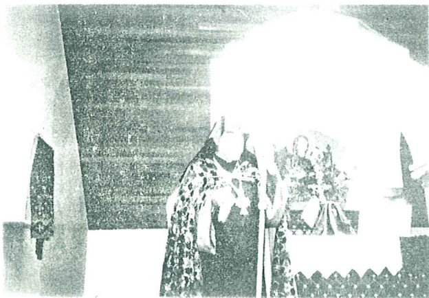
Վեհափառ Հայրապետը բարոգի պահուն