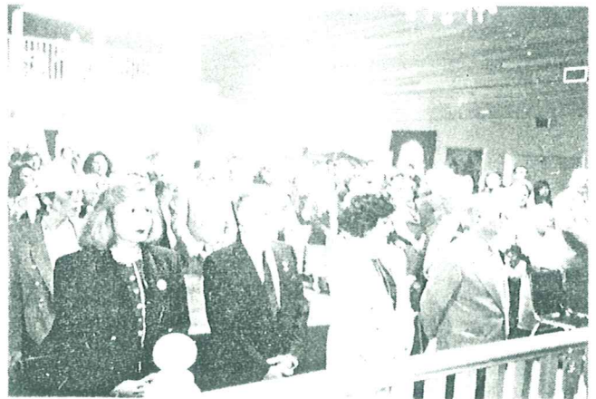
Հաւատացեալներ կը հետեւին հոգեգմայլ արարողութեանց